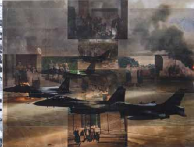
DATES, RADENKO MILAK & ROMAN URANJEK 7 April 1991, Kuwait Oil Fires #1 2017. | 38x102 cm