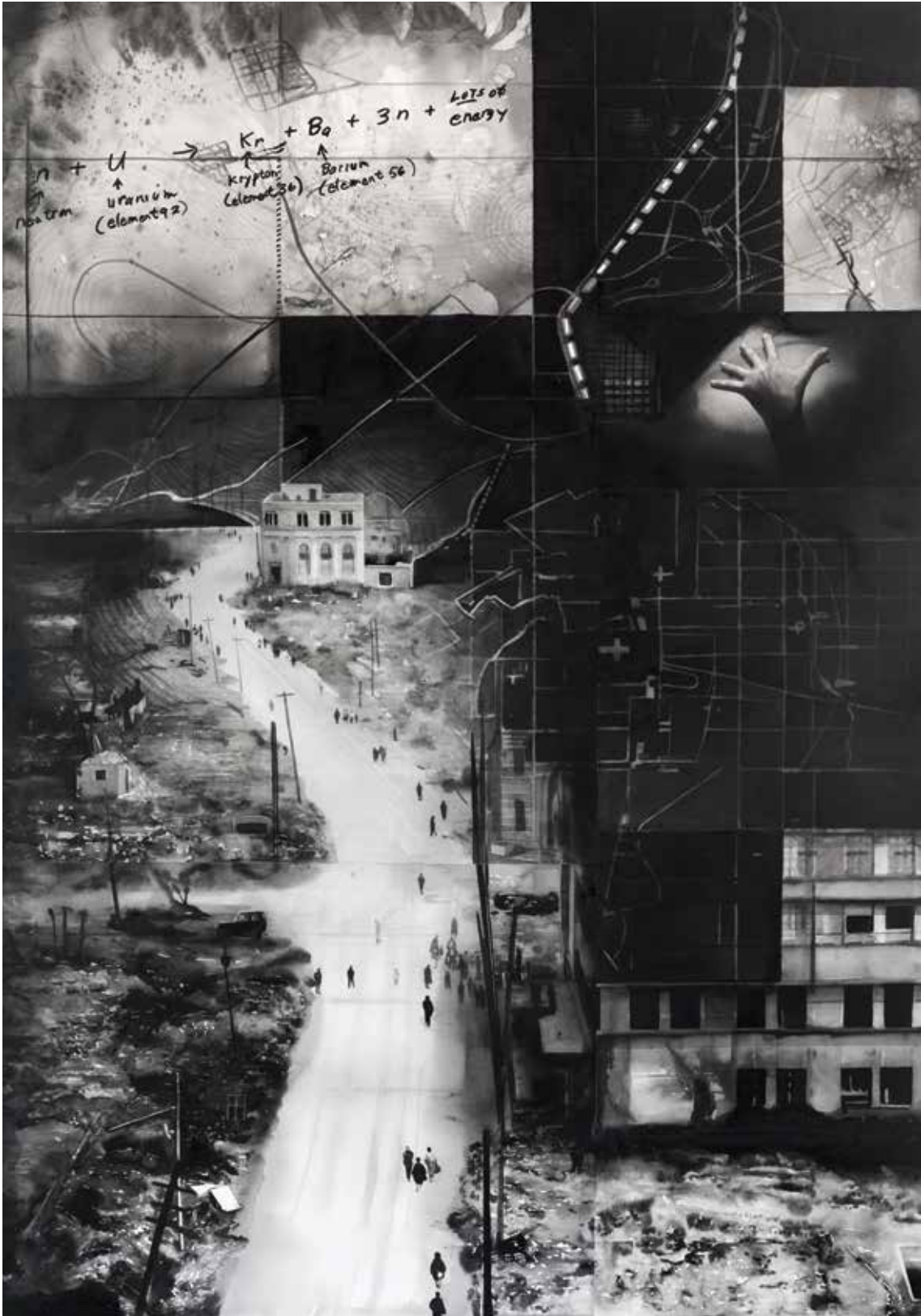
RADENKO MILAK University of Disaster, Fire 2017. | akvarel | 200x140 cm