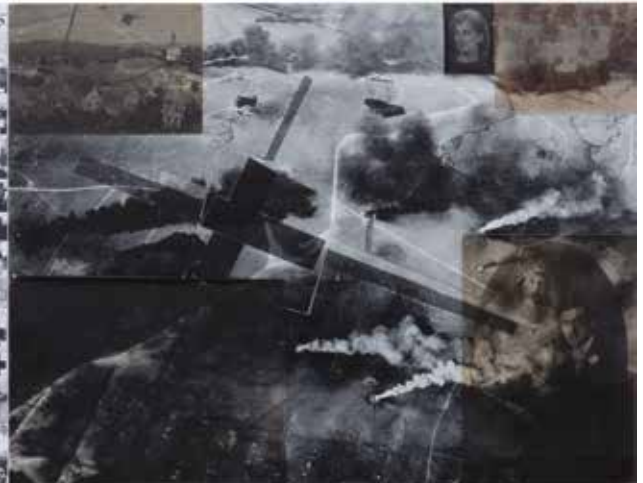
DATES, RADENKO MILAK & ROMAN URANJEK 7 April 1991, Kuwait Oil Fires #2 2017. | 38x102 cm