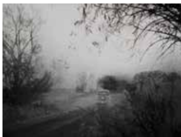
RADENKO MILAK From the Far Side of the Moon 2017. | animirani film | trajanje 13' 21" | kadar iz videa