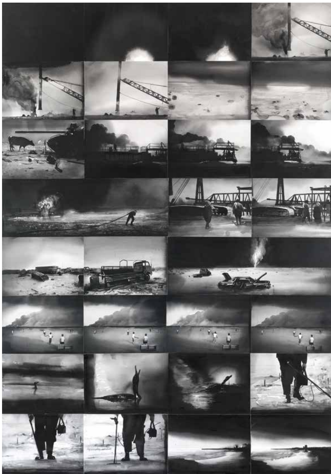
RADENKO MILAK University of Disaster, Earth 2017. | akvarel | 200x140 cm